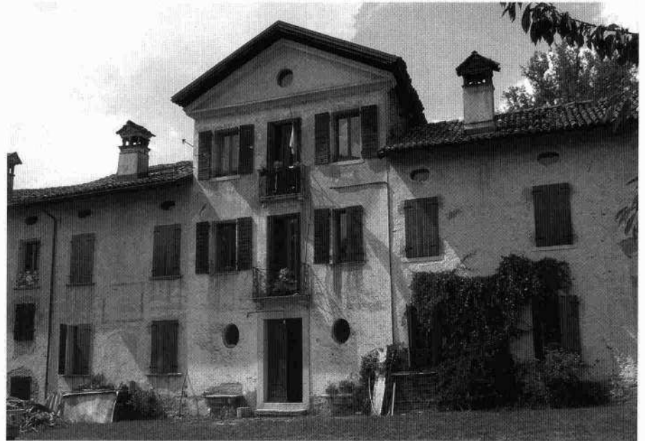
Veduta del complesso da sud